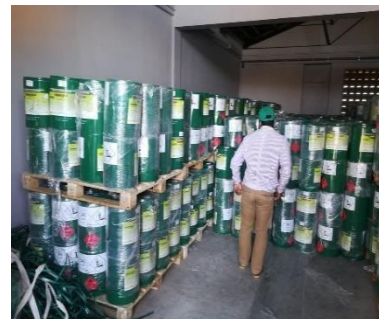
Figure 4 : Magasin de stockage de pesticides Andranomena Toliara

La disponibilité des pesticides est une condition sine qua non de la réussite d'une campagne à une autre. De ce fait, le centre a effectué une acquisition de 50 000 litres de pesticide