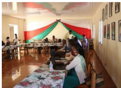
Figure 3 : Réunion d'évaluation technique Betioky Atsimo

Les 12 et 13 juin 2020 à Betioky Atsimo, les techniciens de l'IFVM ont effectué une réunion de réflexion et d'autoévaluation de la campagne 2019-2020. Ils ont pris de recul aux différentes difficultés rencontrés durant