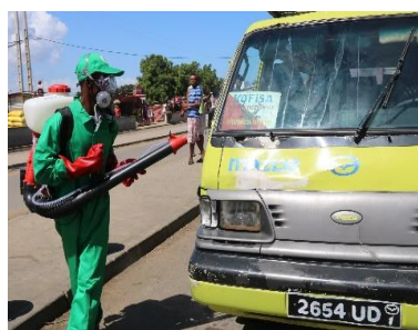
Figure 2 : Désinfection effectuée par l'équipe de l'IFVM à Sakaraha

La guerre contre l'ennemi invisible la pandémie Coronavirus devient de plus en plus rude et difficile. Elle se répand d'une région à une autre même si l'état malagasy prenait plusieurs mesures strictes pour éviter ou stopper sa