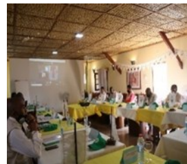
Photo 1: session CA Morondava

La première session ordinaire du Conseil d'Administration de l'IFVM a pu se tenir à l'Hôtel Lagune Beach Morondava le 28 août 2020. Elle s'est déroulée pour la première fois de façon mixte avec visioconférence, car certains membres n'y ont pu être présents dont l'Organe Délibérant du centre a validé à l'unanimité le compte administratif